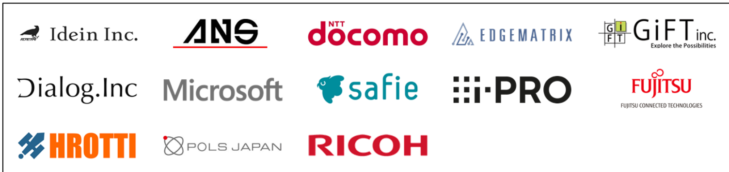
パートナーシップ企業一覧（2021年2月時点）

～マルチプラットフォーム対応 高精度人数カウント AI「Ridge Count」を 近日リリース予定。全国販売展開へ加速～