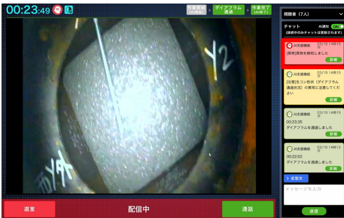
本システムを実装した moni-as 画面