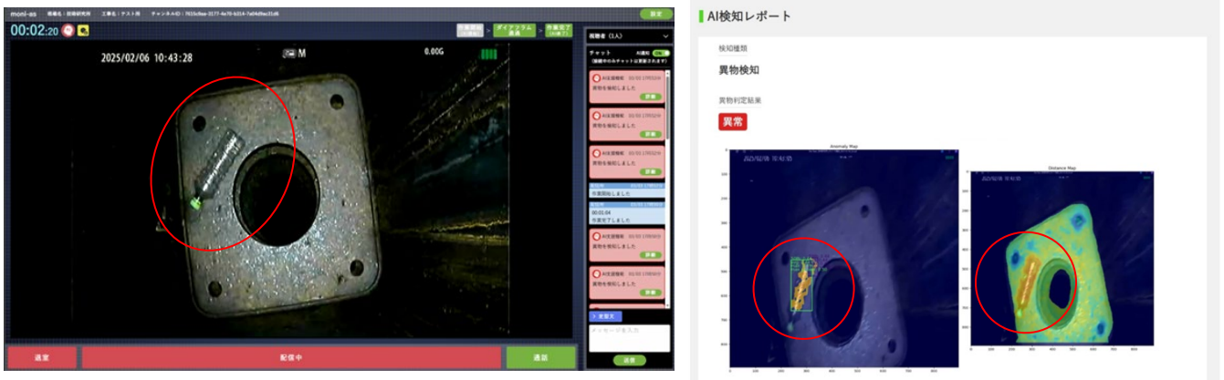
検証のためモックアップに混入させたペットボトルをシステムが検出する様子と診断レポートの例

鋼管柱内にペットボトル等の異物を意図的に混入させる等、異常として検知すべき状況をモックアップ試験で再現し、本システムの効果を検証しました。その結果、「鋼管柱内の異物」、「コンクリート性状」および「ダイアフラムの通過タイミング」の3項目のいずれにおいても、高精度かつリアルタイムに診断、検知できることを確認しました。その後、本システムを複数のCFT構造の実現場に導入し、従来どおり高い品質を確保できることを確認しました。